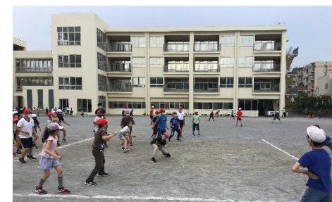
ドッジボールクラブ