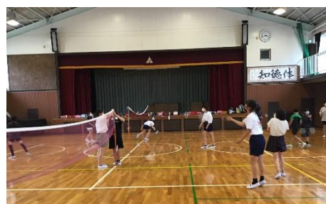
バドミントンクラブ

また、2年ぶりとなりますが水泳学習として着衣泳を実施します。密にならないように配慮しながらの実施となります。プール開きに向けて、6年生がプール清掃をしてくれました。最高学年として黙々と清掃する姿は立派でした。