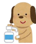
しょうどくしよう