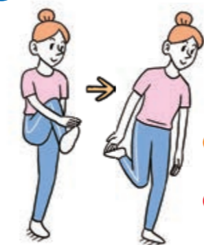
49 つま先・かかとタッチ(右)