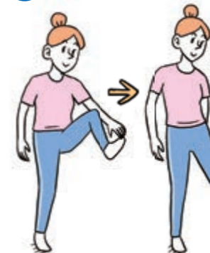
51 つま先・かかとタッチ(左)