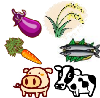
命をわけてくれた植物や動物たちに

11月23日は勤労感謝の日です。毎日何気なく食べている食事ですが、食事を口にするまでの過程にいろいろな人々の手がかかっていることに気づき、感謝の気持ちを持って「いただきます」「ごちそうさま」を言うようにしましょう。