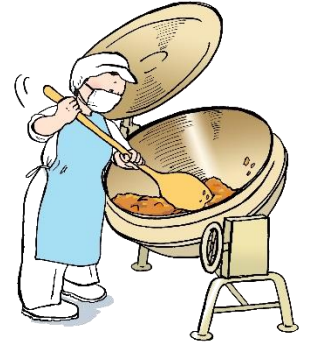
料理を作ってくれる人達に