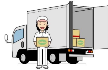
食材料を運んでくれる人達に