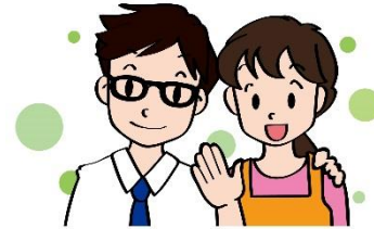
一生懸命働いて、食材料費を払ってくれる保護者に