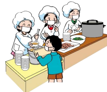
その料理を盛りつける人達(友達)に