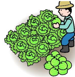
野菜を育てている人達に