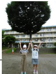
(がんばれ高野山っ子)