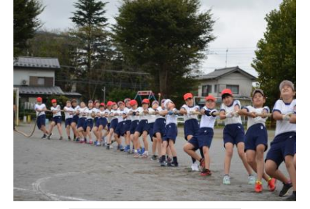
高学年の団体競技