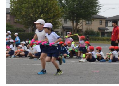
中学年の団体競技