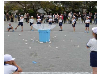
低学年の団体競技