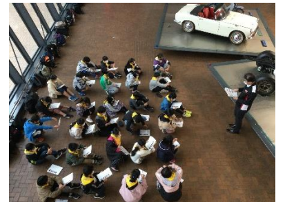
HONDA コレクションホール

12月3日(木)に5年生の校外学習を実施しました。今年度は、新型コロナウイルスの影響で、林間学校が実施できず、その代替の意味合いも含んだ校外学習となりました。栃木県にある「ツインリンクもてぎ」で一日を楽しく過ごしてきました。5年生の児童は、自然散策をしたり、自動車製造について学んだり思い出に残る校外学習となりました。