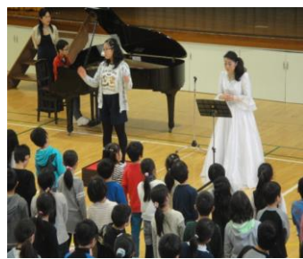
最後はみんなで歌いました