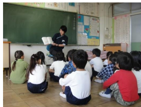
1年生担任による朝の読み聞かせ

本校では、子どもたちの読書への意欲を高めることに取り組んでいます。週に1冊位をめあてに指導・推進をしています。ご家庭でも親子で読書を楽しんでみてください。※11月は7日（火）21日（火）におはなしポケット（朝の読み聞かせ活動）が計画されています。