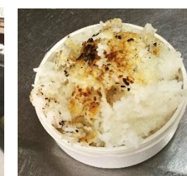
おこげもできるよ！