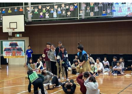
5年生：協力して～6年生！