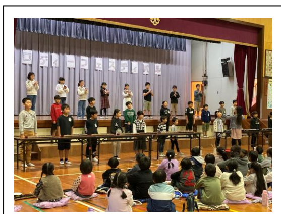
メロディーフェスティバル