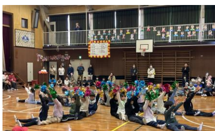
2年生：ひ・ひ・ひがしのいわう会