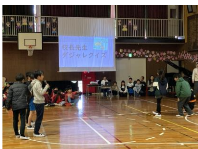
4年生：Let's go! 東小クイズ