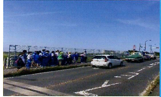
栄橋から布佐の町を眺める