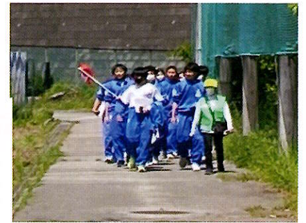
地域の方が安全に誘導