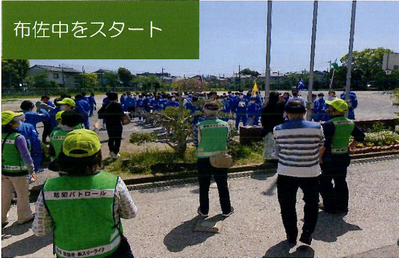
布佐中をスタート