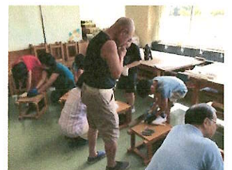
3年生「のこぎりお助けボランティア」