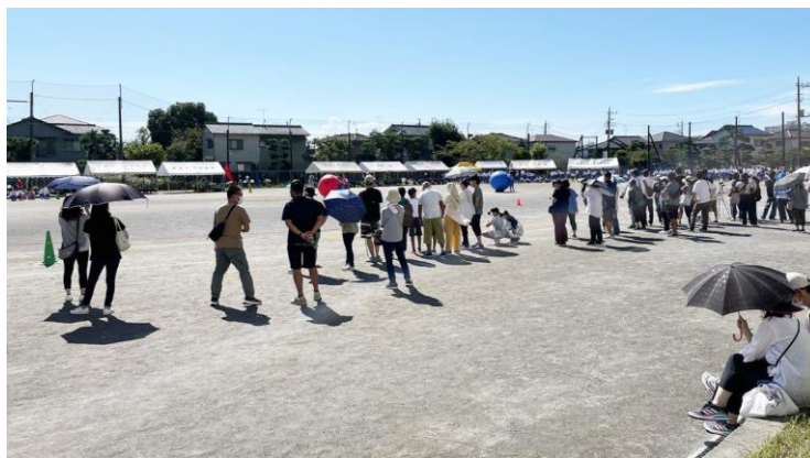
〈競技を参観する保護者の様子〉