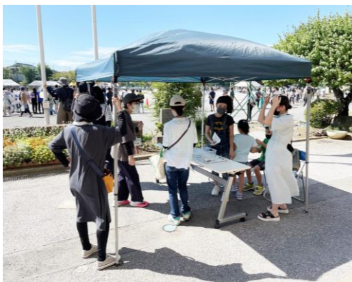
〈PTAによる保護者受付〉

PTAとしては、本部役員に加え学年委員も、体育祭当日の保護者受付・駐輪場管理・違法駐車パトロールなど、お手伝いをさせていただきました。