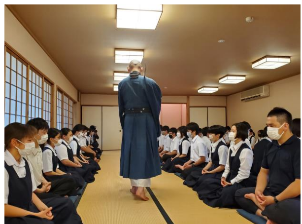
＜座禅をして心をととのえます＞