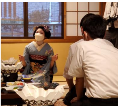
＜舞妓さんに話を聞く様子＞

自分たちで考え行動し、成長した3日間でした。それぞれが、自分の役割を自覚して行動していて、頼もしく感じました。思い出もたくさんできたようです。