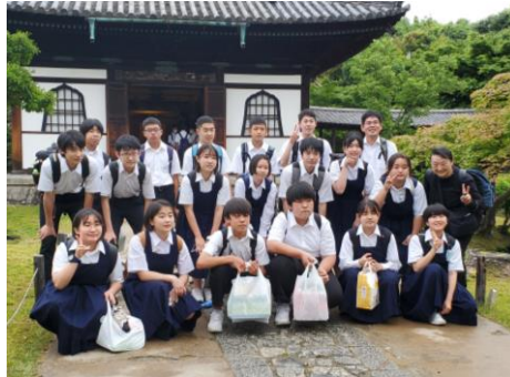
＜高台寺を拝観しました＞