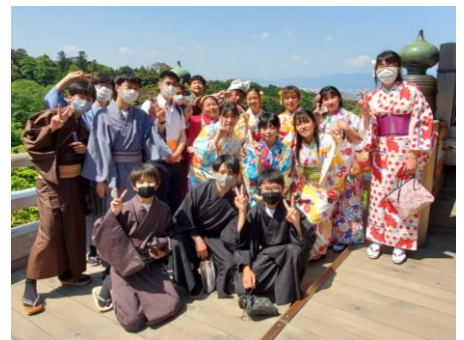
＜着物を着て、清水寺の舞台で＞