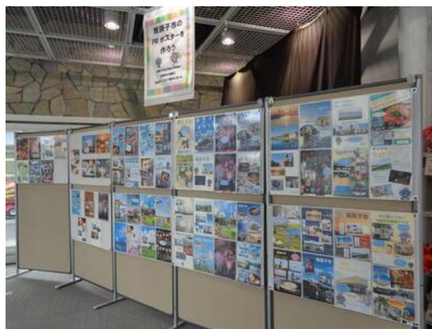
【アビシルベでの展示の様子】