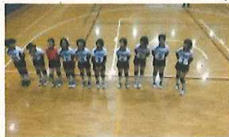
バレーボール部県大会