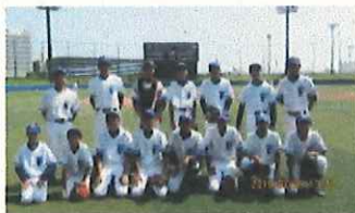
野球部 県大会ベスト8