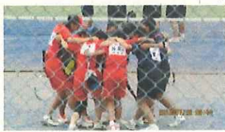
ソフトテニス部団体戦