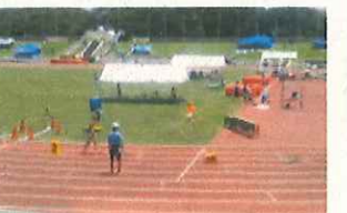
陸上部県大会 400m 予選