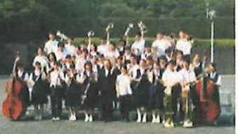
吹奏楽部県コンクール