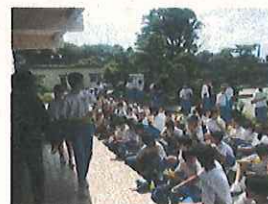
【8月6日生徒会主催草刈り】

保護者・地域ボランティアの皆様、生徒の皆さん、ご協力ありがとうございました 生徒会の皆さんの提唱による生徒による草刈り校内美化活動が8月6日、PTAの皆さんによるものが24日の日におこなわれました。地域のボランティアの皆さんも当日はたくさん参加していただき、みるみるうちに校庭、花壇がきれいになりました。「環境は人をつくる」ということだけでなく、やはり「人が環境をつくる」ということだと思えます。皆さんの心が伝わる大変素晴らしい取り組みとなりました。教育環境の整備・充実については学校の重要な取り組みの一つと考えます。より一層の充実に向けて取り組んでまいりますので引き続きご協力をお願いいたします。本当にありがとうございました。