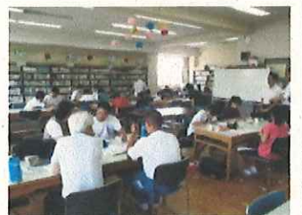
【図書室での学習の様子】