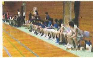
男子バスケットボール部準優勝