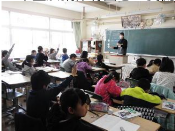
4年生「算数」意欲的に発表