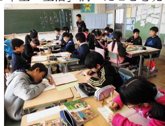
5年生「社会」一生懸命に考える