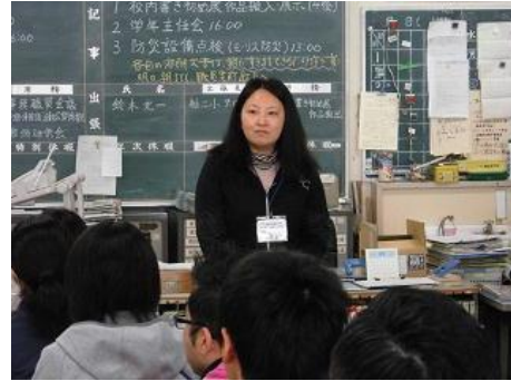
山崎学習サポーターさん