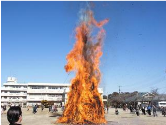
新木ふれあいわんとり