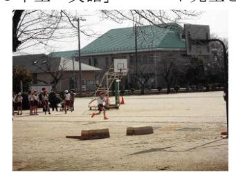
6年生「体育」少しでも遠くへ