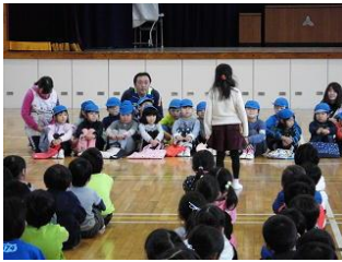
1年生双葉保育園との交流

多くの保護者の皆様にご来校いただき、子ども達の成長の様子を見ていただきました。ご多用の中、本当にありがとうございました。2月の学習参観・懇談会も是非お越しください。