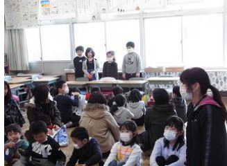
2年生「生活」調べたことを発表