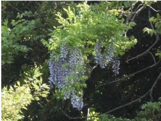
駐車場奥の林に咲いた藤