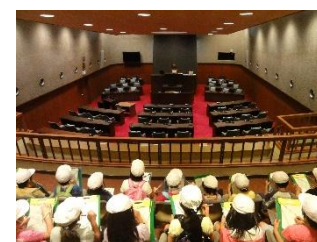
市役所見学 「議事堂の中」

◎個人面談のお知らせを7日(火)に配布します。担任から学校でのお子さんの成長をお伝えするとともに、ご家庭での様子をお伝えいただけたらと思います。