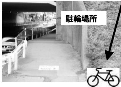
高架下入口大型マンション側