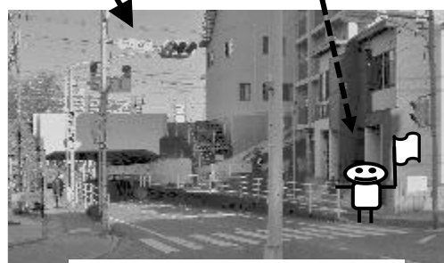
②チュリス我孫子前横断歩道