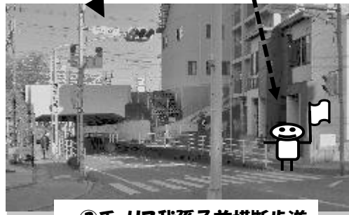
②チュリス我孫子前横断歩道