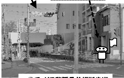
②チュリス我孫子前横断歩道