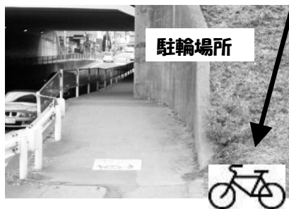
高架下入口大型マンション側