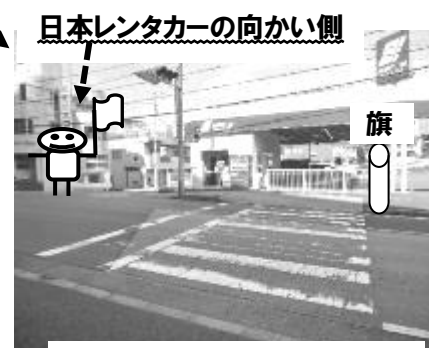
①日本レンタカー前横断歩道