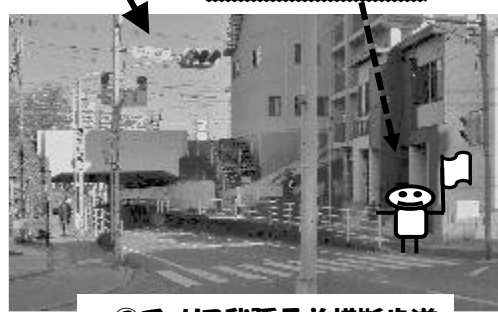
②チュリス我孫子前横断歩道