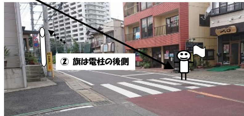
② 「パール歯科」斜め前(店舗側)