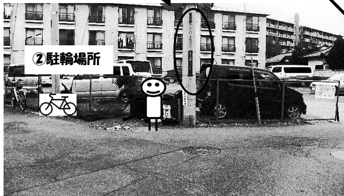
② “船戸一丁目 3”の電柱が目印 十字路にある駐車所の付近です