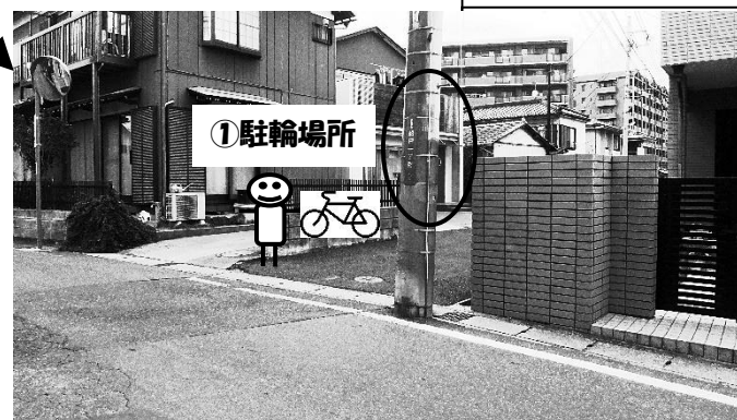
① “船戸一丁目 2”の電柱が目印。 大きなT字路ではなく、イトーピアよりの交差点付近です