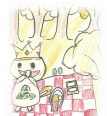
三小キャラクター「サンサン」