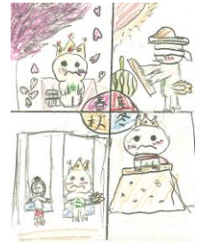
児童の描いたイラスト