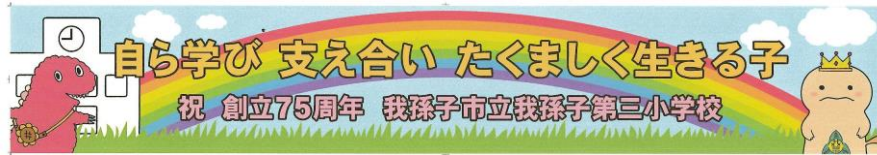
創立75周年横断幕デザイン