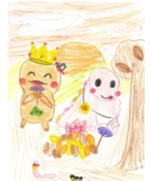
三小キャラクター「サンサン」と「ひまザウルス」