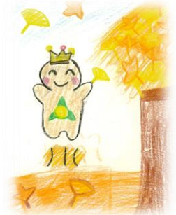
三小キャラクター「サンサン」