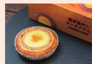
特別賞 1名 濃厚焦がしチーズバウム 〈6個入り〉 (見波亭)