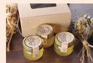
家族写真賞1名 天然ハチミツセット 〈百花蜜・れんげ・くすのぎ〉 (八八)