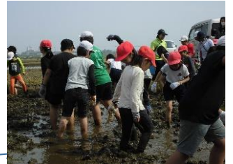
5年生田おこしの様子

学校では、いよいよ5月13日より「令和」最初の運動会の練習が始まります。先日1年生の防犯教室で来校されたお客様からは、1年生のしっかりと話を聞く姿勢にお褒めの言葉を頂きました。また4月22日の田おこしでは、3、4、5年生が元気いっぱい活動し、活気溢れる子ども達の様子が見られました。これからもけじめをつけて、友だちと協力する大切さや最後までやり抜く姿勢など、本校児童が心豊かに成長していけるよう努力してまいります。保護者・地域の皆様のご理解・ご協力・ご支援のほど宜しくお願い申し上げます。