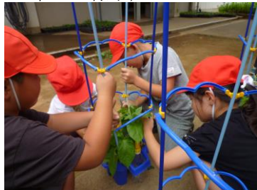
(6月の一年生の様子)