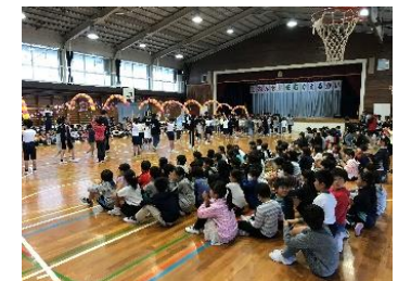
1年生が喜んでくれた迎える会