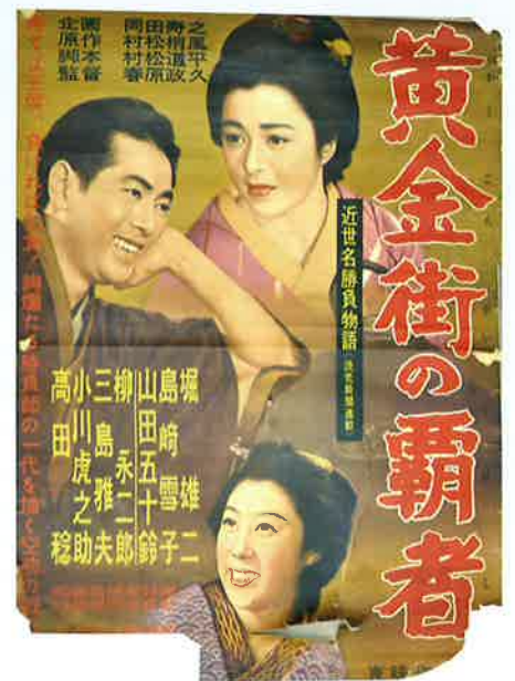
映画「黄金街の覇者」ポスター（個人蔵）