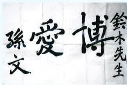
孫文直筆の書（大磯町郷土資料館）