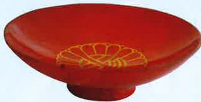
衆議院議員時代の賜杯（大磯町郷土資料館）