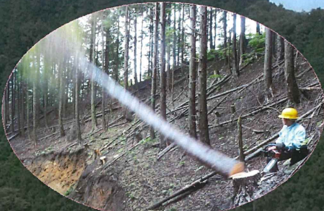
立木の伐倒作業を安全な場所から見学