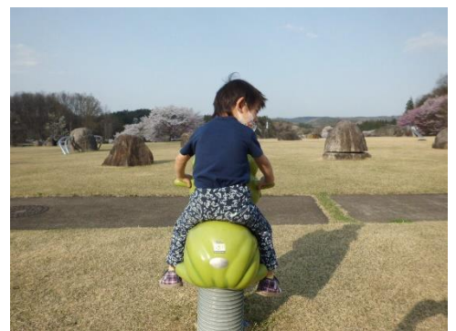
♪クリスタルパーク石の広場にて♪