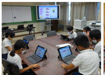
【昆虫の体のつくりをプログラミングで】【4年生は都道府県を覚えるプログラム】【音読を録画して読み方を確認】