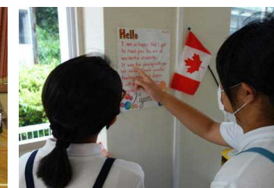
【キヨミ先生からのメッセージ! 読めるかな。】