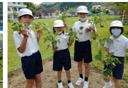
【枝豆がたくさんできたよ】