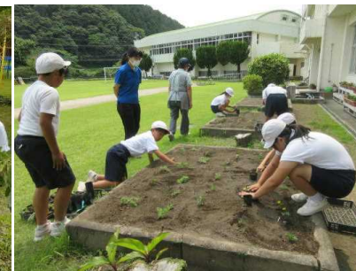
【学級園も夏の花の準備中】