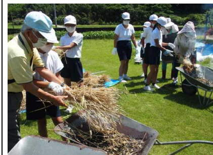
【70年ぶり! の大麦の脱穀】