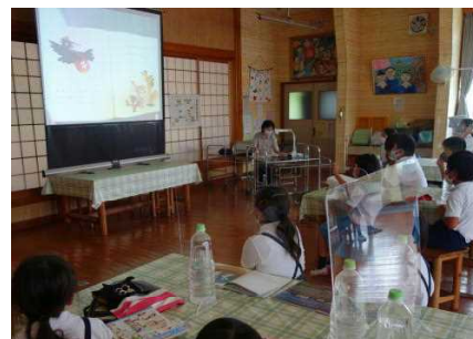
【田淵さん「おてがみでーす」等】