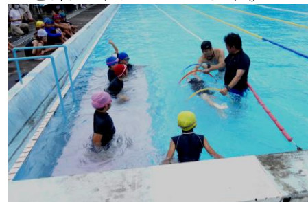
【3～6年生 力強い泳ぎです】【1・2年生 けのびをして輪くぐり】