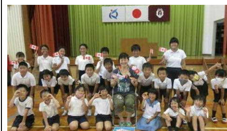
【キヨミ先生3年間ありがとう】