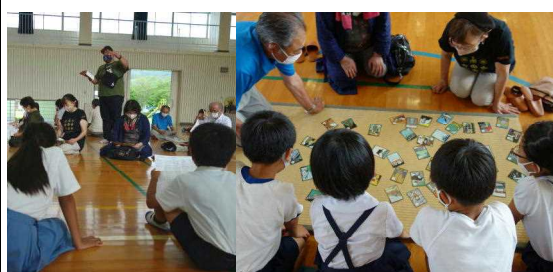
【たけだんの妖怪の話と観光ガイドの方とカルタとり】【図書委員会による紙芝居】【図書を使って保健の学習】