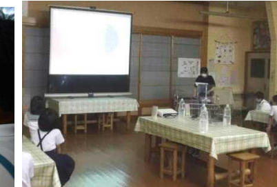
【What color? White!】