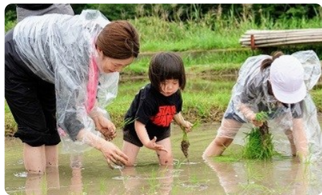
最年少 家族で さいごまでがんばりました

毎年ご協力いただいている地域の皆さまも多数ご参加くださり、子供たちは苗を植える手を動かしながら、地域の方や保護者の方々と自然なふれあいを楽しんでいました。ぬかるんだ田んぼに足を取られながらも、笑顔いっぱいの子供たちの姿がとても印象的でした。