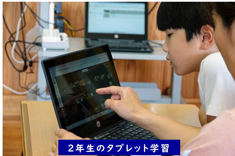
2年生のタブレット学習