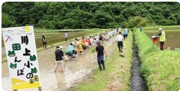
地域・保護者・児童・先生、いっしょに田植え

本校が大切にしている「地域とともにある教育」の姿が、まさにこの日の田植えに表れていたように思います。子供たちの笑顔と、地域・保護者の皆さまのあたたかなまなざし。その光景に、改めて学校のあり方を感じさせられました。子供たちにとって、こうした体験は一生の財産です。ご参加・ご協力くださった皆さまに、心より感謝申し上げます。