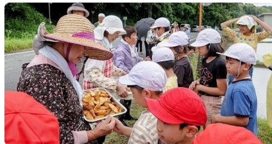
地域の方々から、子供たちに