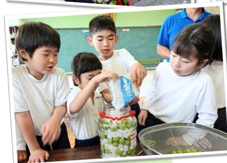
5月15日（木）収穫した梅で、 熱中症対策のシロップづくり