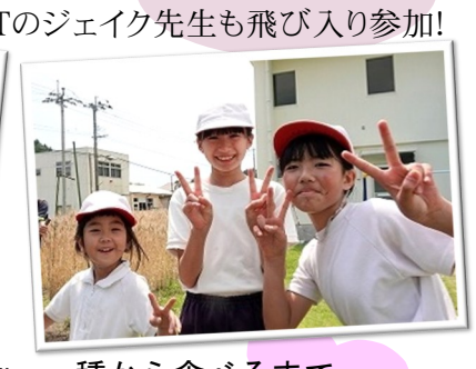
種から食べるまで 協力してがんばります!