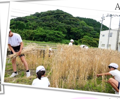
5月28日（水）学校畑の小麦収穫 粉にして、スイーツをつくります。