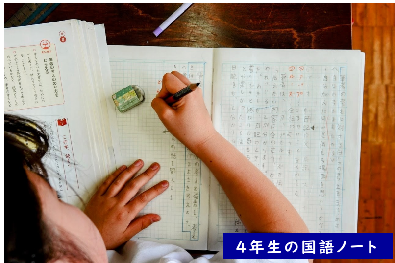
4年生の国語ノート