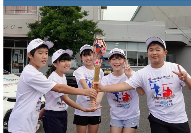
7月31日（月）6年生 炬火リレーに参加