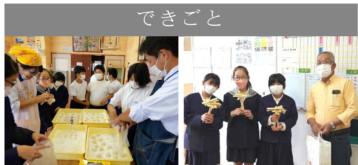
11/4 餅つき (学校田で収穫した餅米)

11月17日（木）、学校の畑で、土壌改良と焼き芋を兼ね、燻炭をつくりました。子供たちは、慣れた手つきで、煙突のまわりにアルミホイルで包んだ紅はるかを並べました。 予想以上に時間がかかりましたが、子供たちは美味しく焼きました。