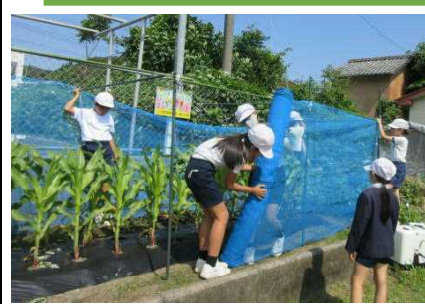
【力を合わせて防風ネット作り】