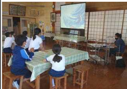
【小牟田さん「のはらのせんたくやさん」等】【市立図書館「ありえない」等】