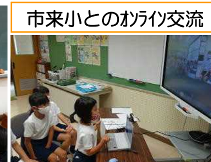
【自己紹介「私はメロンが好きです」】