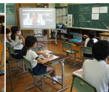
【自宅からリモートで一緒に学習】