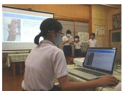
【自分たちでユニセフのプレゼン】