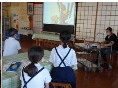
【日高さん「どうぞのいす」等】