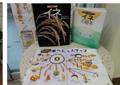
【田植えに合わせて「イネ」コーナー】