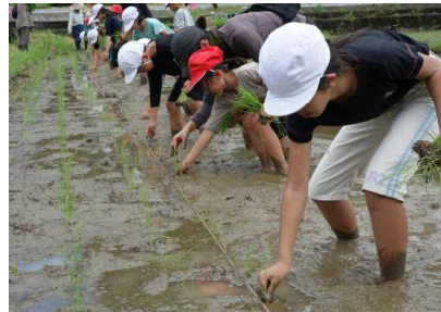
【青空の下、上手に植えられました】