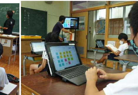
【ふせんソフトでオンラインの話し合い】