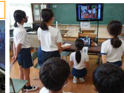
【川上小のことを紹介します】