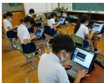
【タイピングも上達してきました】