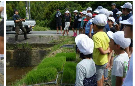
【今年も高齢者クラブのご協力で田植え】