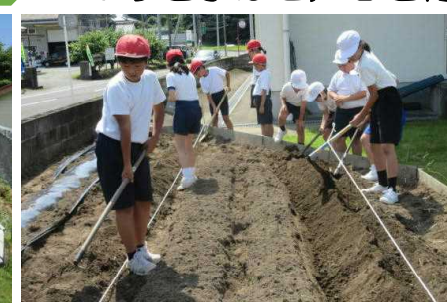
【慣れた手つきでサツマイモ畑の準備】【もみまき、一粒一粒丁寧に隙間なく!】