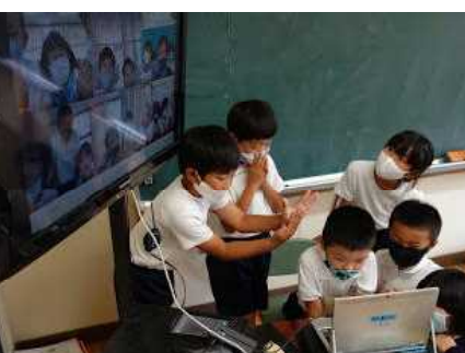
【知っている友だちがいるよ】