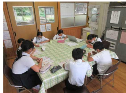
【5・6年生は英検準備スタート】