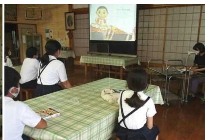
【井内さん「たべてあげる」等】