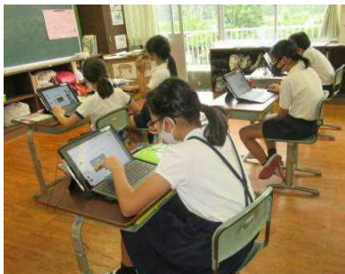
【宿泊学習のまとめを3校でスライドに】