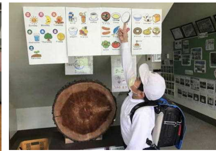
【breakfast(朝食)はegg!(卵)】【What fruit do you like? I like apples!】