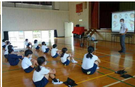
【全校朝会「笑顔発表会」】