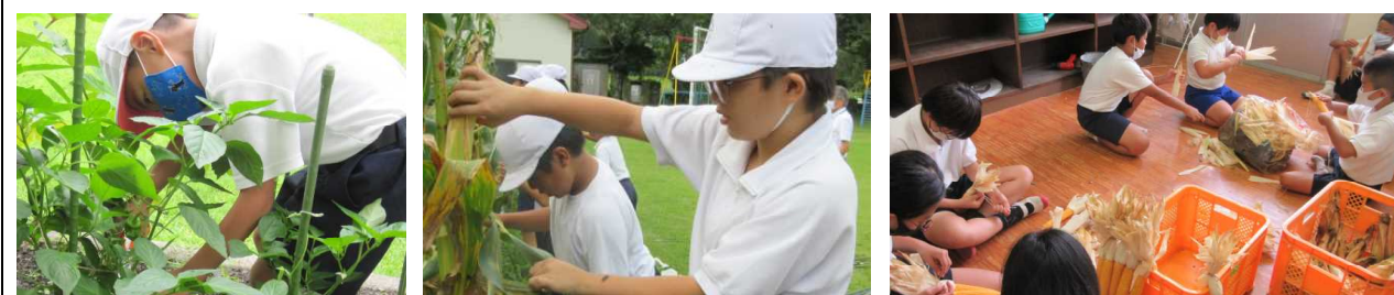
【大きく育ったピーマンの収穫】 【下へボキッとトウモロコシ収穫】 【乾燥させてポップコーンパーティーの準備】