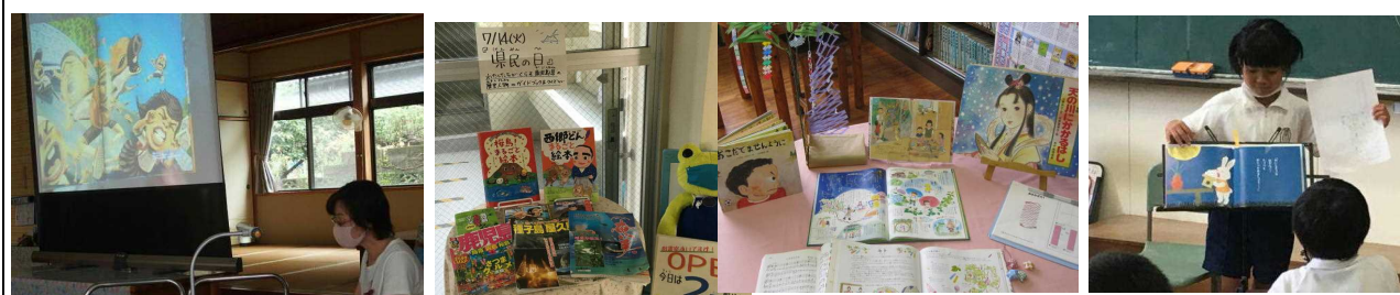
【大賀さん鹿児島弁で「飼育係長」】 【「県民の日」「七夕」のコーナー】 【1・2年生 おすすめの本】