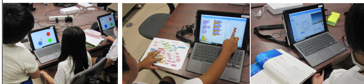
プログラミング教育…【3年生 こんにちはのからだ】【4年生 鹿児島市の町村】【6年生 「やまなし」をアニメで】