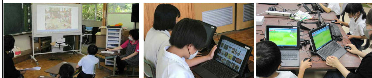
【給食時間にお行儀よくしてるかな】 【熊本の食べ物を調べよう】 【1年生 初めてのマウス練習】