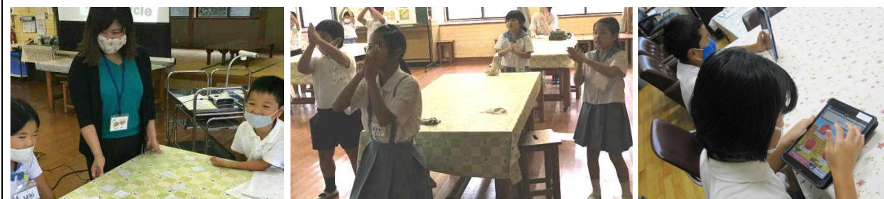
【小屋先生と乗り物の名前の学習】 【パブリカを英語で歌って踊ります】 【タブレットで英単語の勉強】