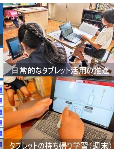
日常的なタブレット活用の推進