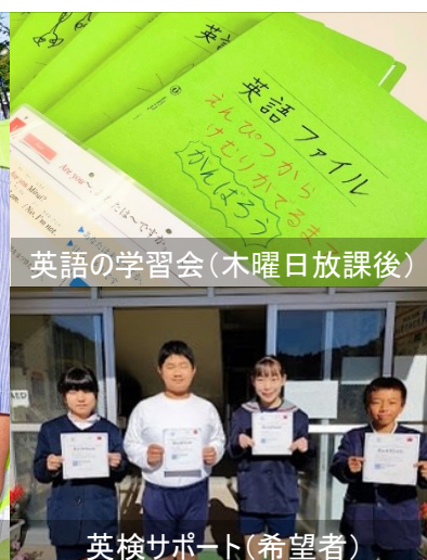
英語の学習会(木曜日放課後)