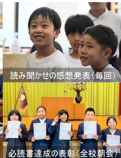
読み聞かせの感想発表(毎回)