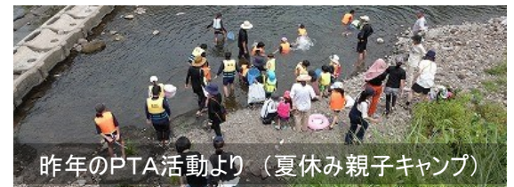
昨年のPTA活動より（夏休み親子キャンプ）

(川上コミュニティ協議会会長) (お話カンガルー) (元PTA会長, 川上踊師匠) (元PTA会長, 川上踊唄者) (現PTA会長)