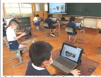
【プレゼンを協働編集「好きなもの紹介」】【デジタルドリルで1年間の総復習】