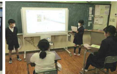
【野菜作りをパソコンでまとめて発表会】