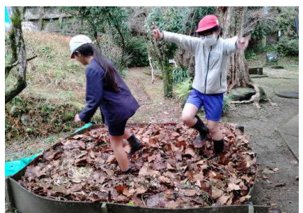
【落ち葉を集めて「いい腐葉土になれ!」】