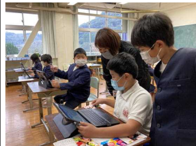
【プレゼン作り「ここはどうするの?」】