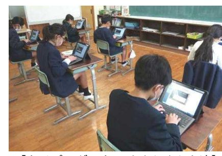
【タイピングスキルはぐんぐん上達】