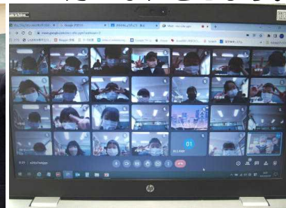
【全校朝会はオンラインで】