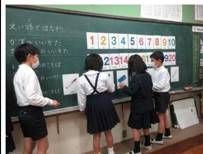
【One Two 数の言い方覚えたよ】