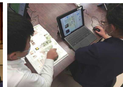
【図書を使った調べ学習「麦の育ち方」】【地域の方の寄付で新しい本を買いました】