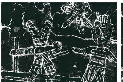
【MK「ぼくの大すきなオニヤンマ」】