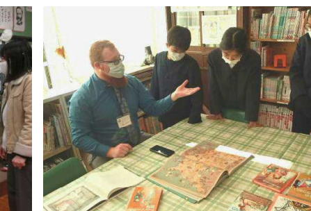
【アメリカの説明を英語で。分かるかな】【カノン先生と楽しいイングリッシュタイム】