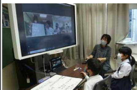
【冠岳小と算数の授業「ぼくと同じ考えだ」】