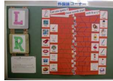
【外国語コーナー LとRどっちかな】