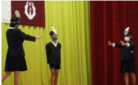
【川上フェスタ セタの話を英語劇で】