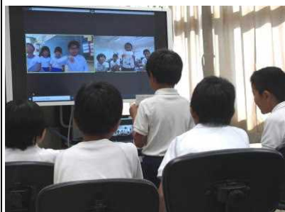
【2年生「ぼくが好きなものは」】