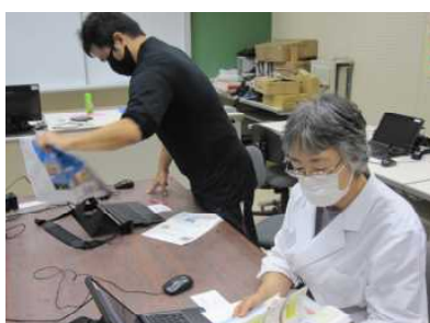
【先生もパソコン活用の研修中】