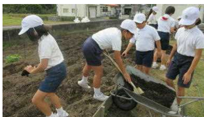
【自家製の腐葉土で次の準備】