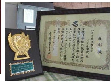
【県「子どもの読書活動推進優良校」表彰】