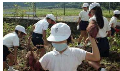
【大きいものがたくさんできたよ】