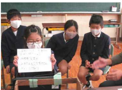
【4年生 川上小クイズ分かるかな】