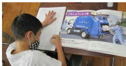
【ゴミ収集車はどんなつくりかな】【図書委員会のパネルシアター、大好評】【「たいこさん」から本が届いたよ】