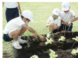
【冬野菜、大切に育てよう】