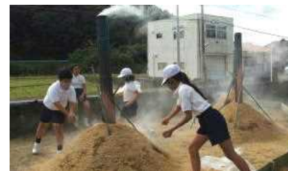
【くん炭作り、煙が目にしみる〜】