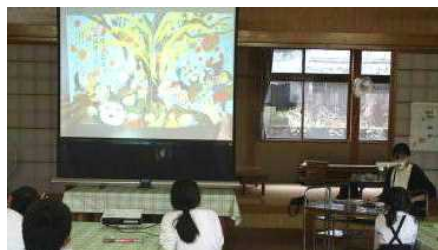
【M,Uさん「へっこきよめさま」等】