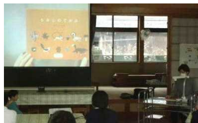
【M,Uさん「もみじのてがみ」等】