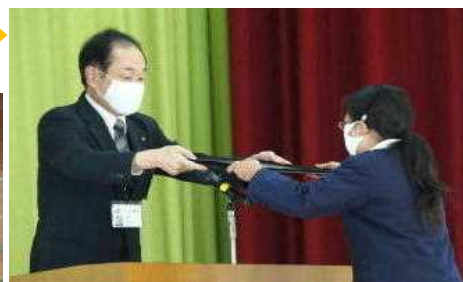
【無事故5500日!次は6000日を目指して】