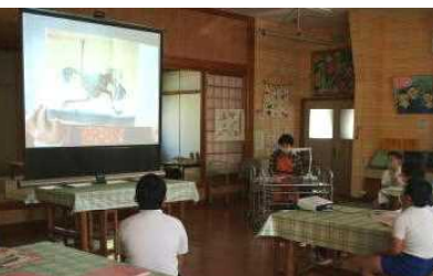
【M,Hさん「かたあしダチョウのエルフ」等】