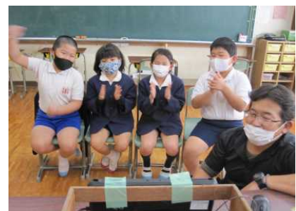
【3年生 転校したお友達に会えたよ】