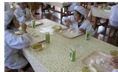
【つくたてのお餅、おいしいな】