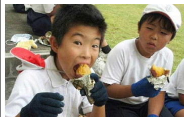
【頑張ったごぼうびは焼きいも】