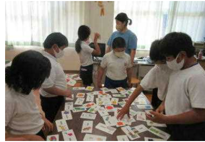
【大文字と小文字のペアを見つけよう】