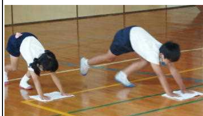
【チャレンジ集会 ぞうきんダッシュ】