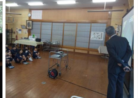
【全校朝会～「これからの学び」】