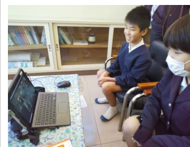
【6年生国語科～旭小・冠岳小と～】