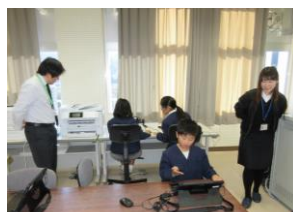
【3年生 キーボード練習】【国語科の報告文もPCでまとめます】