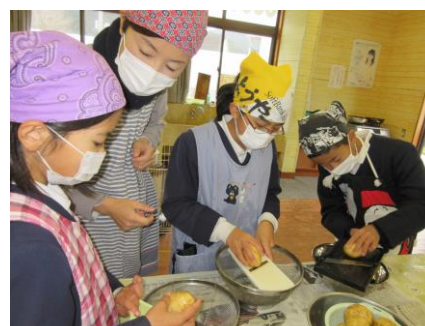
【3～6年生 念願のじゃがいもパーティー】