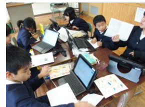
【各学年の普段の授業風景から～主体的・対話的に学ぶ～】