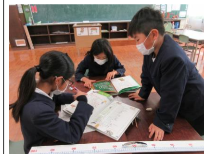
【3年算数科「重さ」の学習】