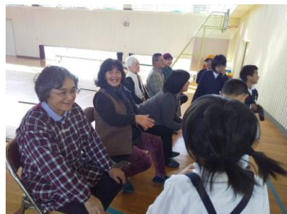
【イングリッシュタイム～ポッチャなどのニュースポーツを通して地域の方と一緒に英語を学びます。～】