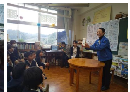
【代表4名によるビブリオバトル大会】