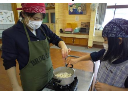
【種まき～防風ネット張り～収穫～乾燥～そして完全手作りポップコーンづくりへ～】