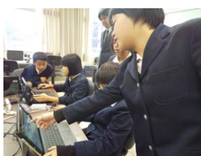
【5・6年生プログラミング学習 算数科「正多角形と円」】