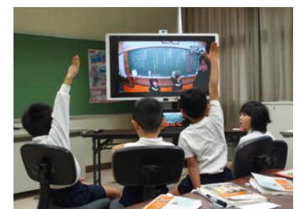
【1年生国語科～荒川小と～】