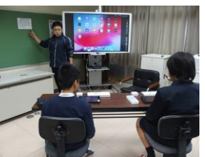
【6年生 プログラミング学習 理科「電気とわたしたちの暮らし」】