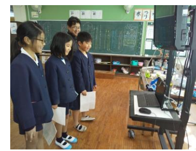
【3年生国語科～冠岳小と～】