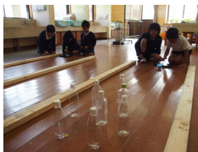
【1・2年生プログラミング学習 「ボールを命令通りに動かすぞ！」】