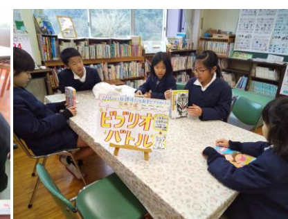
【昼休み ビブリオバトル予選会】